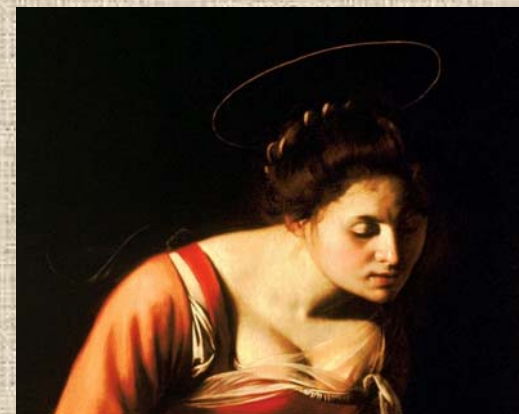
Caravaggio, Madonna dei palafrenieri , particolare

Ave, o Maria, piena di grazia, il Signore è con te. Tu sei benedetta fra le donne e benedetto è il frutto del tuo seno, Gesù. Santa Maria, Madre di Dio, prega per noi peccatori, adesso e nell'ora della nostra morte. Amen.