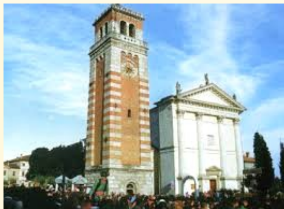
Parrocchia San Zenone Aviano