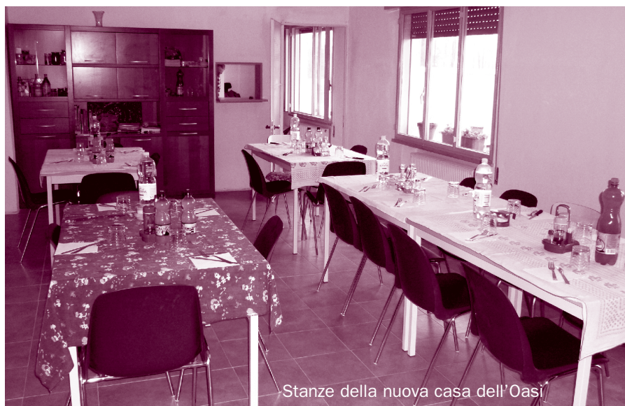
Stanze della nuova casa dell'Oasi

La domenica ha avuto come obiettivo concreto la partecipazione delle parrocchie all'inaugurazione della struttura gestita dalla Cooperativa Oasi, ricavata dall'edificio che ospitava gli spogliatoi e l'alloggio del custode del campo di calcio "A. Cal" in Comina. L'intera proprietà è stata data in gestione gratuita nel 2000 alla Cooperativa Oasi dalla Parrocchia del S. Cuore, come segno del Giubileo, e l'edificio esistente è stato trasformato in residenza per alcuni ex carcerati. Questo è stato poi acquistato dal comune nel 2006 e mantenuto in gestione all'OASI, che l'ha rinnovato e