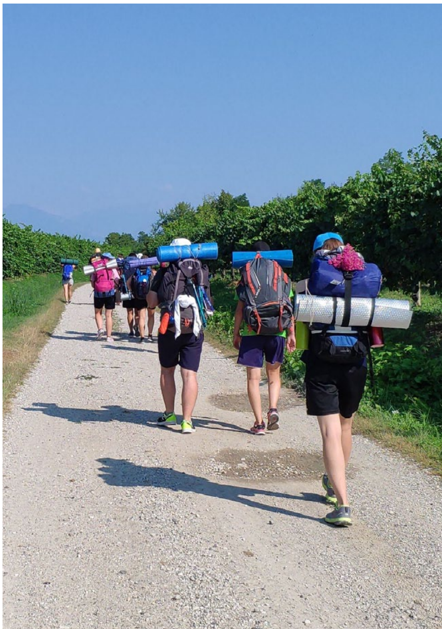
Giovani della Diocesi durante il Cammino della Concordia - agosto 2018