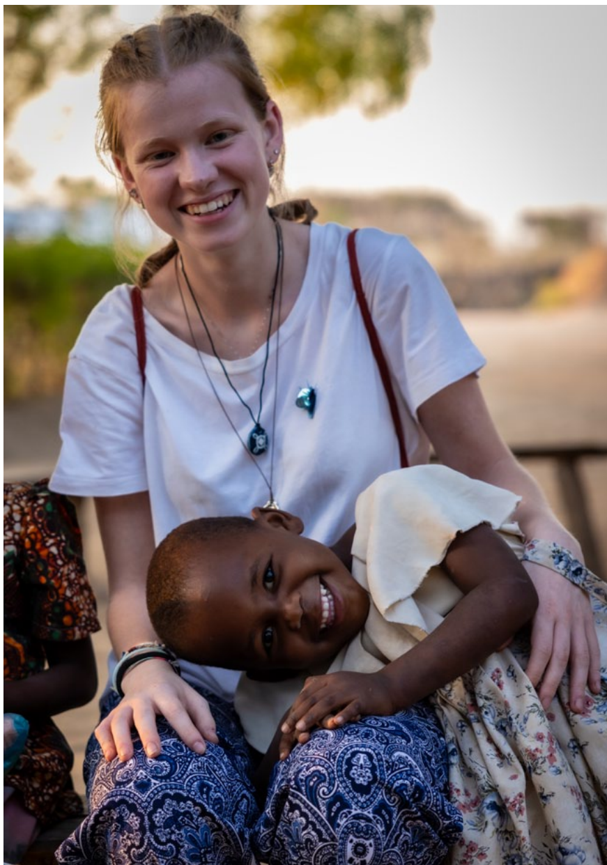
Serena, viaggio PEM in Tanzania - Luglio 2023