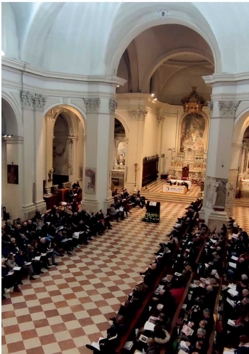
Assemblea Sinodale Generale - Concattedrale San Marco a Pordenone - Gennaio 2024